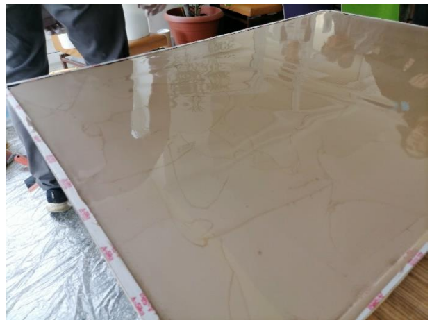
Názorné ukážky aplikácie polyuretánovej podlahy na vzorke