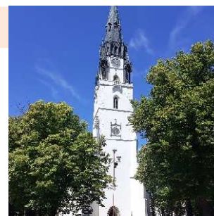
Spišská Nová Ves - veža