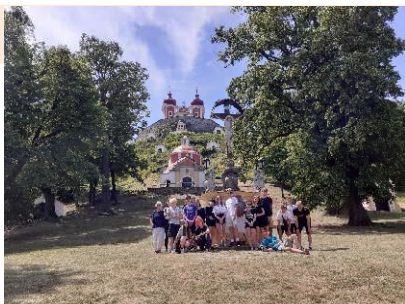
Banská Štiavnica - kalvária