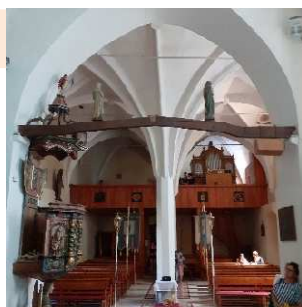
Dravce – gotický kostol