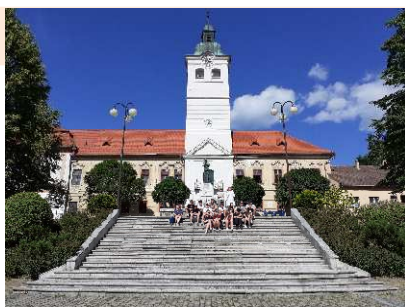
Gelnica – banské múzeum