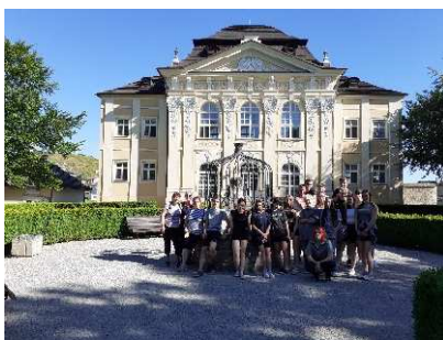
Markušovce – zámocký hudobný pavilón