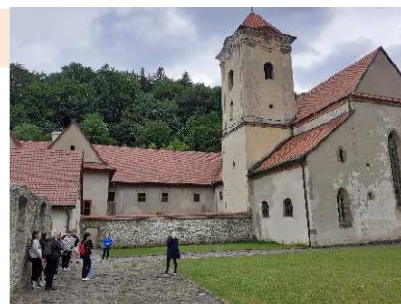
Komplex Červeného kláštora