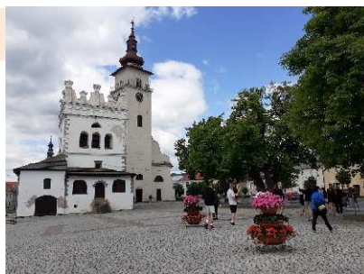
Podolíneec, kostol a zvonica na námestí