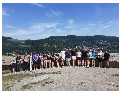
Pohľad z kalvárie na Banskú Štiavnicu