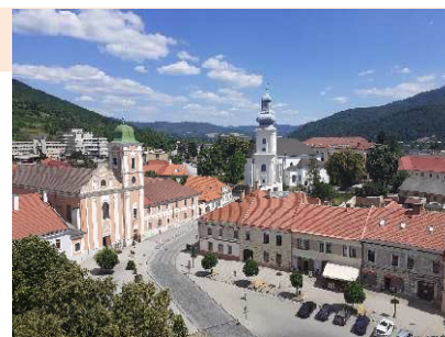
Rožňava – stredoveké námestie