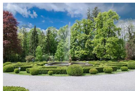
Betliar – zámocký areál