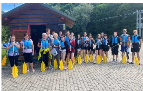
Splav Dunajca na raftoch