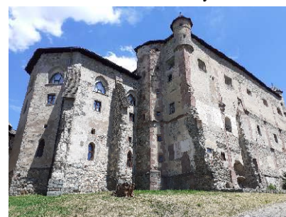
Banská Štiavnica – starý zámok