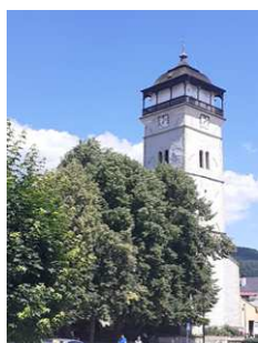
Rožňavská strážna veža