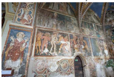
Ochtiná – kostolík, freska