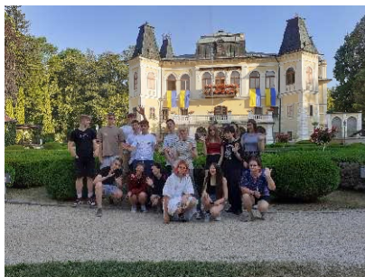
Betliar - zámok