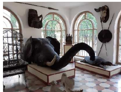
Betliar – múzeuú