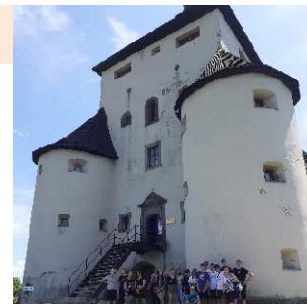
Banská Štiavnica –Nový zámok