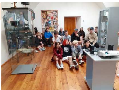
Spišská Belá – múzeum J.M.Petzvala