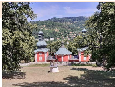
Banská Štiavnica - kalvária