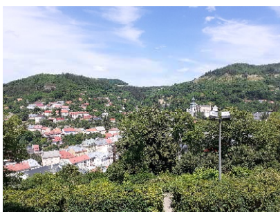
Banská Štiavnica - pohľad na Starý zámok